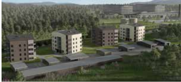
FORBACKEN I GÄLLIVARE.