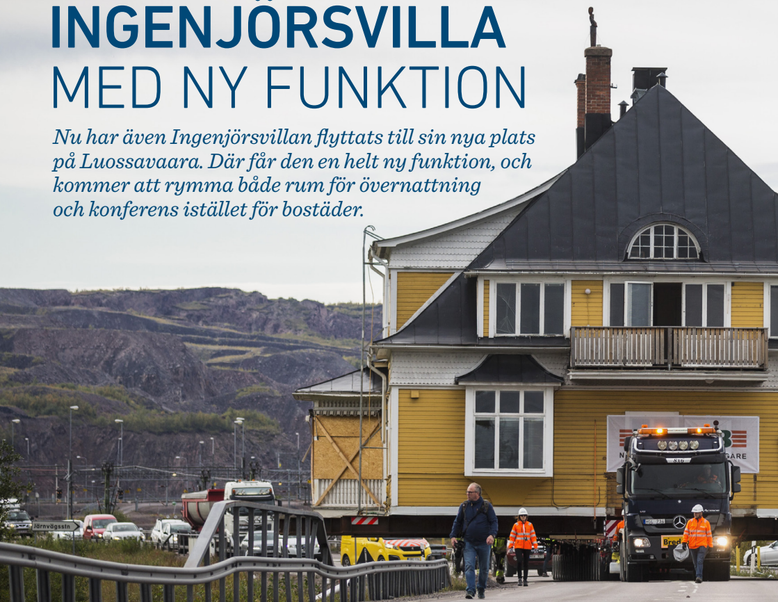
INGENJÖRSVILLAN, PASSERAR ÖVER ETT AV MÅNGA HINDER PÅ VÄGEN MOT SIN NYA PLATS VID LUOSSAVAARA.

Nu har även Ingenjörsvillan flyttats till sin nya plats på Luossavaara. Där får den en helt ny funktion, och kommer att rymma både rum för övernattning och konferens istället för bostäder.