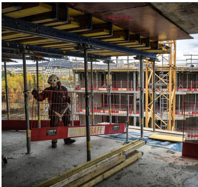
NÄR BOSTADSOMRÅDET FORSBACKEN I GÄLLIVARE ÄR FÄRDIGT KOMMER FYRA PUNKTHUS ATT STÅTA MED SITT LÄGE INVID VASSARAÄLVEN.

När bostadsområdet är färdigt under senare delen av 2018, kommer fyra punkthus