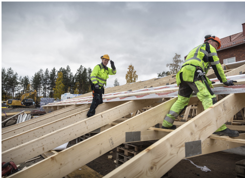
HUSEN PÅ GENVÄGEN BLIR KLARA FÖR INFLYTTNING SOMMAREN 2018.

D et var i våras som markarbetena för att anlägga de fem bostadshusen på Genvägen påbörjades. Det arbetet har pågått hela sommaren, och fortskrider nu under hösten, med bland annat schaktning och terrassering.