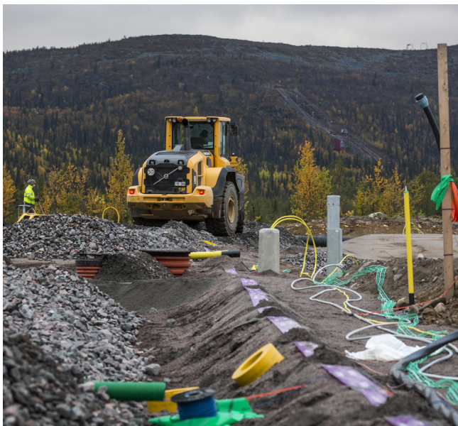
BYGGSTART FÖR 88 LÄGENHETER NEDANFÖR DUNDRET I REPISVAARA, GÄLLIVARE.

Det är en byggteknik som skiljer sig från de två övriga bostadsbyggnadsprojekten som LKAB Fastigheter