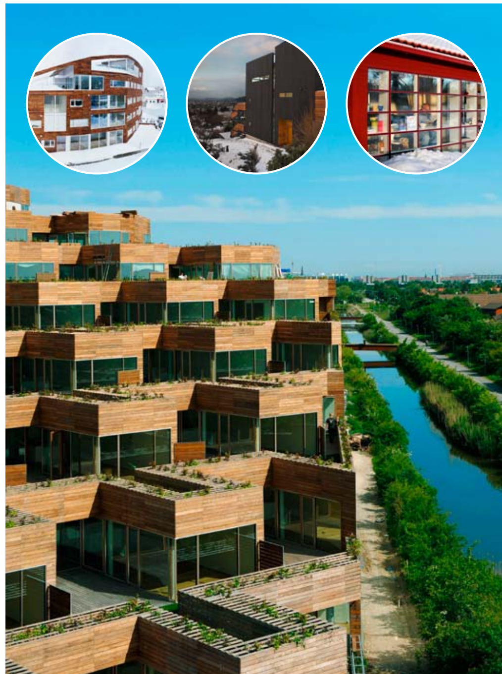
En inspirationsbild av hur det skulle kunna se ut med terrassbygget uppför sluttningen. Exakt hur husen ska se ut är ej klart.

– Det finns motsvarande planer för Gällivare, vi har ett inriktningsbeslut om att bygga 200 nya bostäder. Där måste vi förvärva mark först, konstaterar Aidanpää-Edlert.