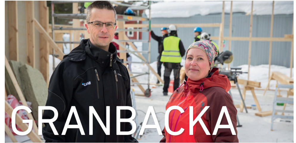
GYMNASIELEVERNA I FULL FÄRD MED ATT BYGGA GÅRDSHUSET PÅ GRANBACKA.