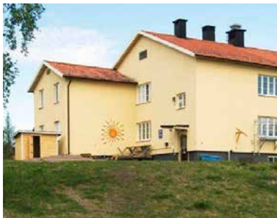
Vita Viddernas förskola får fler elever och får därför också utökade lokaler.